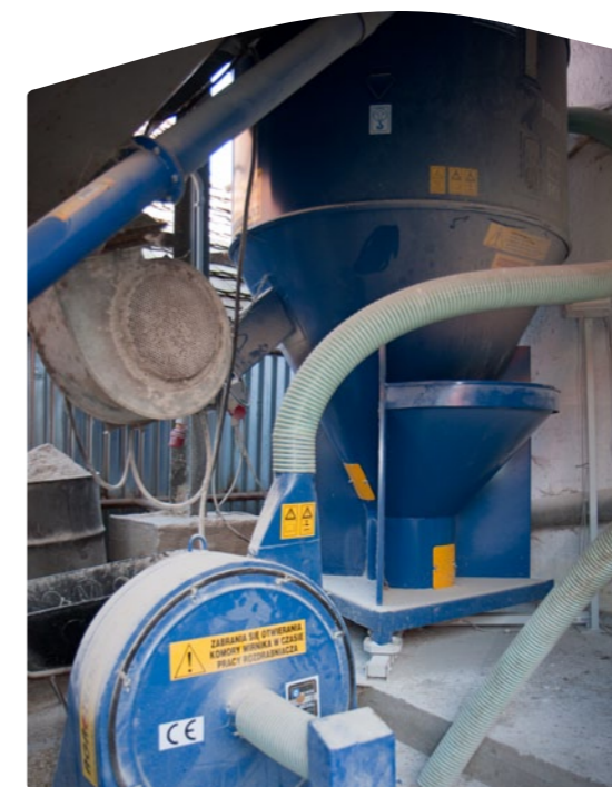
Nový šrotovník a míchárna.

Stojíme před nově vybudovanou stájí, kam se vejde pětatřicet telat. Ty chovají Dvořákovi výhradně pro maso. Majitel je pyšný zejména na své býčky, kteří po vytažení elektricky ovládaných vrat výkrmnu zvědavě natahují hlavy k objektivu fotoaparátu.