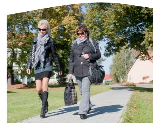
Chodník podél frekventované silnice v Žimuticích.

O rok později se opravené komunikace dočkali i v sousedních Krakovčicích. Tentokrát se jednalo o 110 metrů dlouhý úsek vozovky vedoucí ke zdejšímu hřišti, která dostala nový asfalt a na několika místech byla zpevněna. Současně byly instalovány i nové lavičky a koše. Z Leaderu se tehdy podařilo získat 375 tisíc.